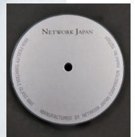
美しいシルバーラベル